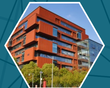
Ler Technology Co., Ltd Wuxi, China http://lertech.com