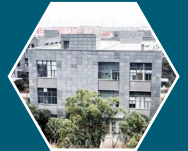
Sinomags technology Gebäude A11, Nr. 1, Jinxi Road55130 Nordic Industrial Park, Bezirk Zhenhai, Ningbo, China 315200 www.sinomags.com

Die Eröffnung von BENGBU im Jahr 2020 erweitert das breite Spektrum der Wertschöpfungstiefe der Sinomags-Gruppe durch Produktionsmöglichkeiten für Chip-on-Board (COB) und SMD-Bestückungslinien.