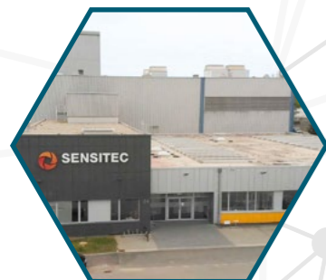
Sensitec GmbH Walter-Hallstein-Str. 24 55130 Mainz · Germany www.sensitec.com

Der Standort in MAINZ/DEUTSCHLAND wurde im Jahr 2003 erworben und verfügt über eine umfangreiche Produktionskapazität für Wafer und Chips. Neben der Wafer-Produktion und umfassenden Test- und Inspektionsmöglichkeiten ist an diesem Standort auch die Chipentwicklung ansässig.