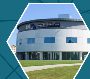
INL Nanotechnology Laboratory Braga, Portugal https://inl.int/

In BRAGA/PORTUGAL besitzt Sinomags neben dem Standort in Mainz eine zusätzliche Wafer-Produktionsmöglichkeit. Am Standort in Braga können im INL - International Iberian Nanotechnology Laboratory TMR-Wafer hergestellt und getestet werden.