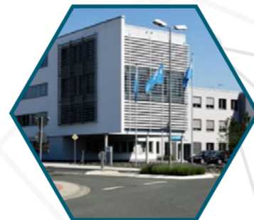
Sensitec GmbH Schanzenfeldstr. 2 35578 Wetzlar · Germany www.sensitec.com