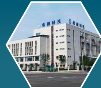
Sinomags technology Bengbu, China www.sinomags.com

NINGBO in China fungiert als bedeutender Produktionsstandort. Hier befinden sich nicht nur die eigentliche Produktion mit umfassenden Test- und Prüfkapazitäten, sondern auch ein Lager, administrative Bereiche für die Produktion und eine Entwicklungsabteilung.