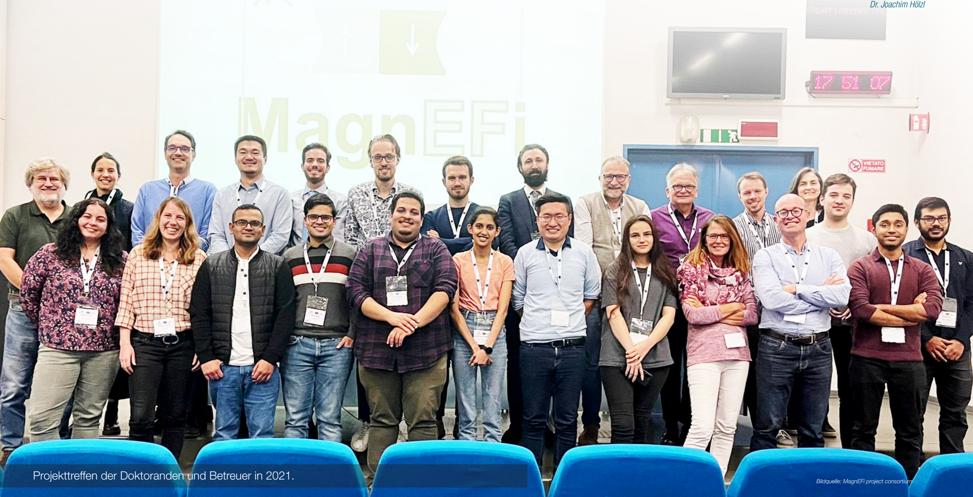
Projekttreffen der Doktoranden und Betreuer in 2021.