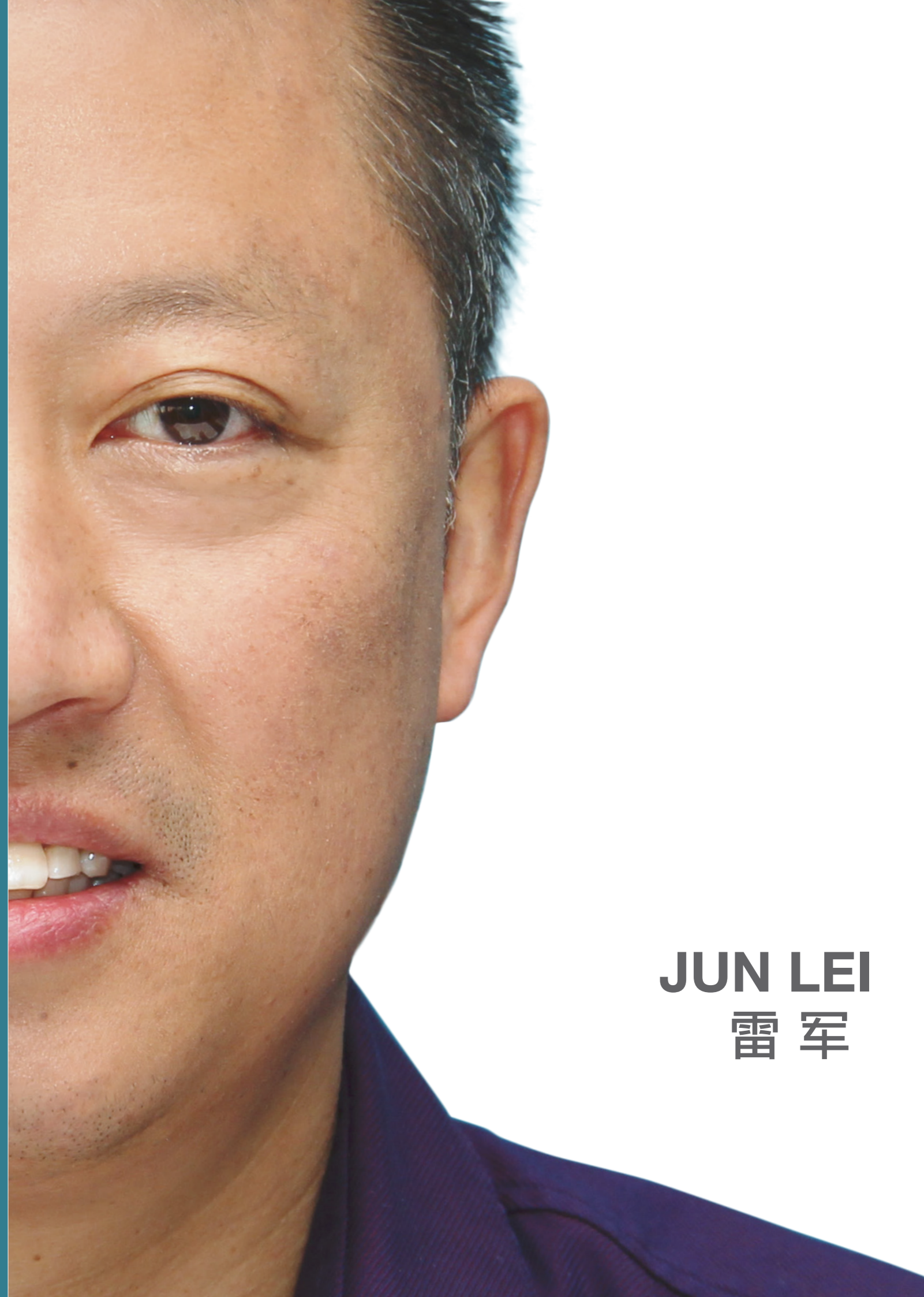
JUN LEI 雷军

Lei ist privat auch ein leidenschaftlicher Schachspieler und liest philosophische Bücher zum Gedankenausgleich. In seiner Freizeit treibt der bekennende Camper seit vielen Jahren sportliche Aktivitäten wie Joggen und Schwimmen.